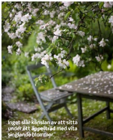
Inget slår känslan av att sitta under ett äppelträd med vita singlar blommor.