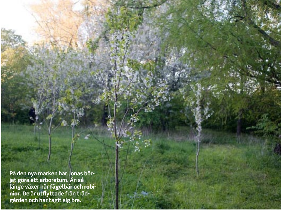
På den nya marken har Jonas börjat göra ett arboretum. Än så länge växer här fågelbär och robinior. De är utflyttade från trädgården och har tagit sig bra.