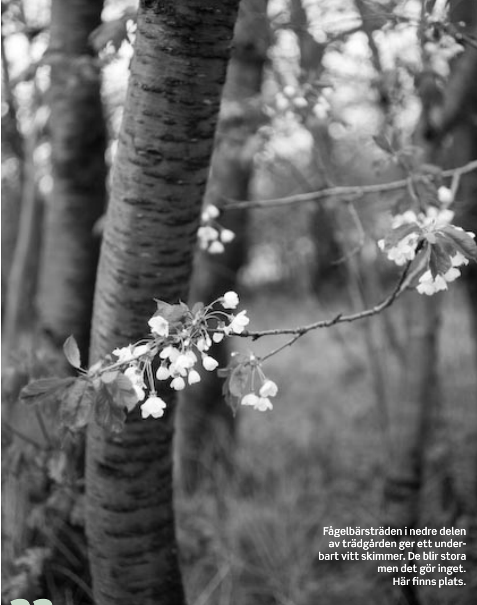
Fågelbärsträden i nedre delen av trädgården ger ett underbart vitt skimmer. De blir stora men det gör inget. Här finns plats.