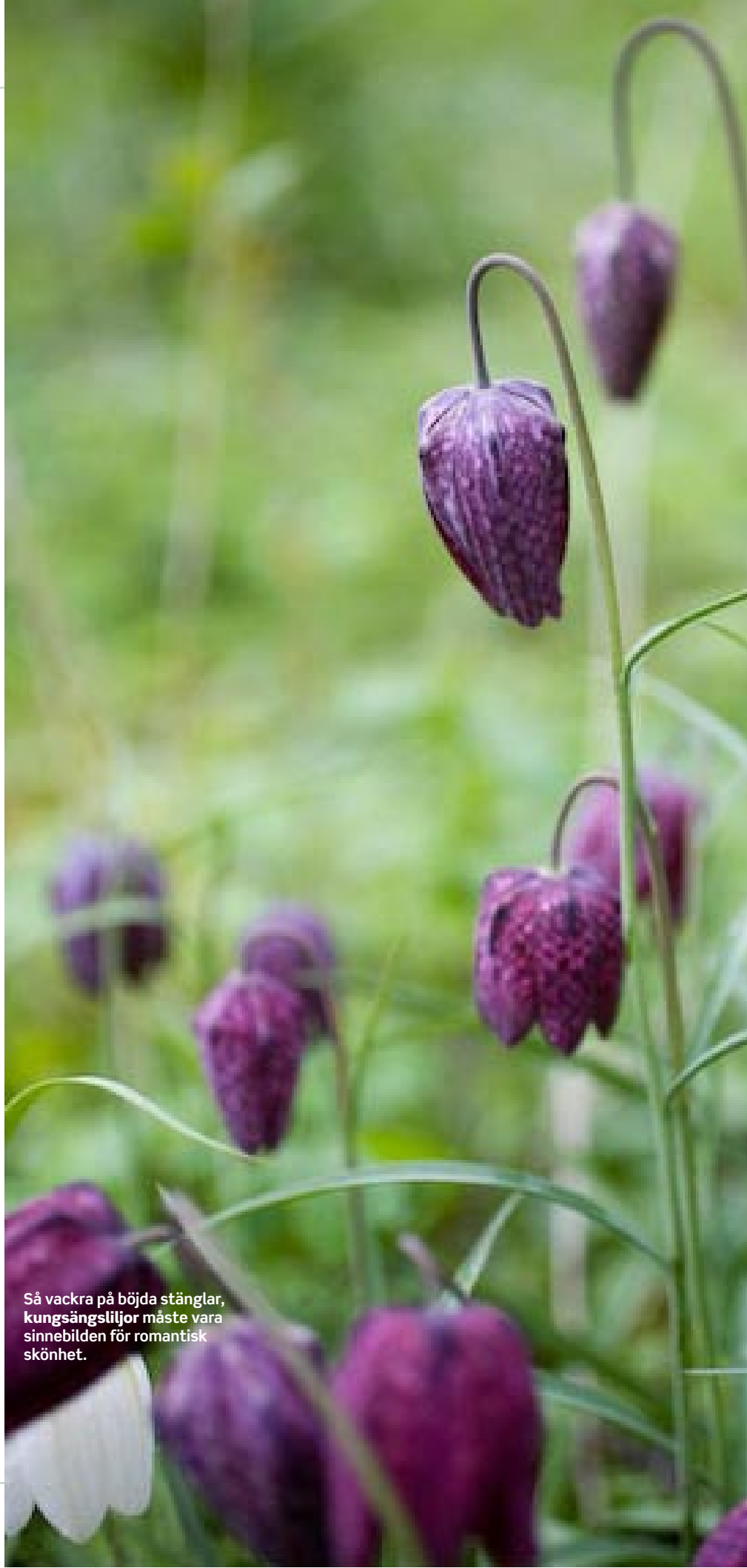
Så vackra på böjda stänglar, kungsängsliljor måste vara sinnebilden för romantisk skönhet.