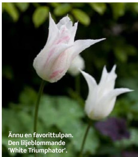
Ännu en favorittulpan. Den liljebloommande "White Triumphator".