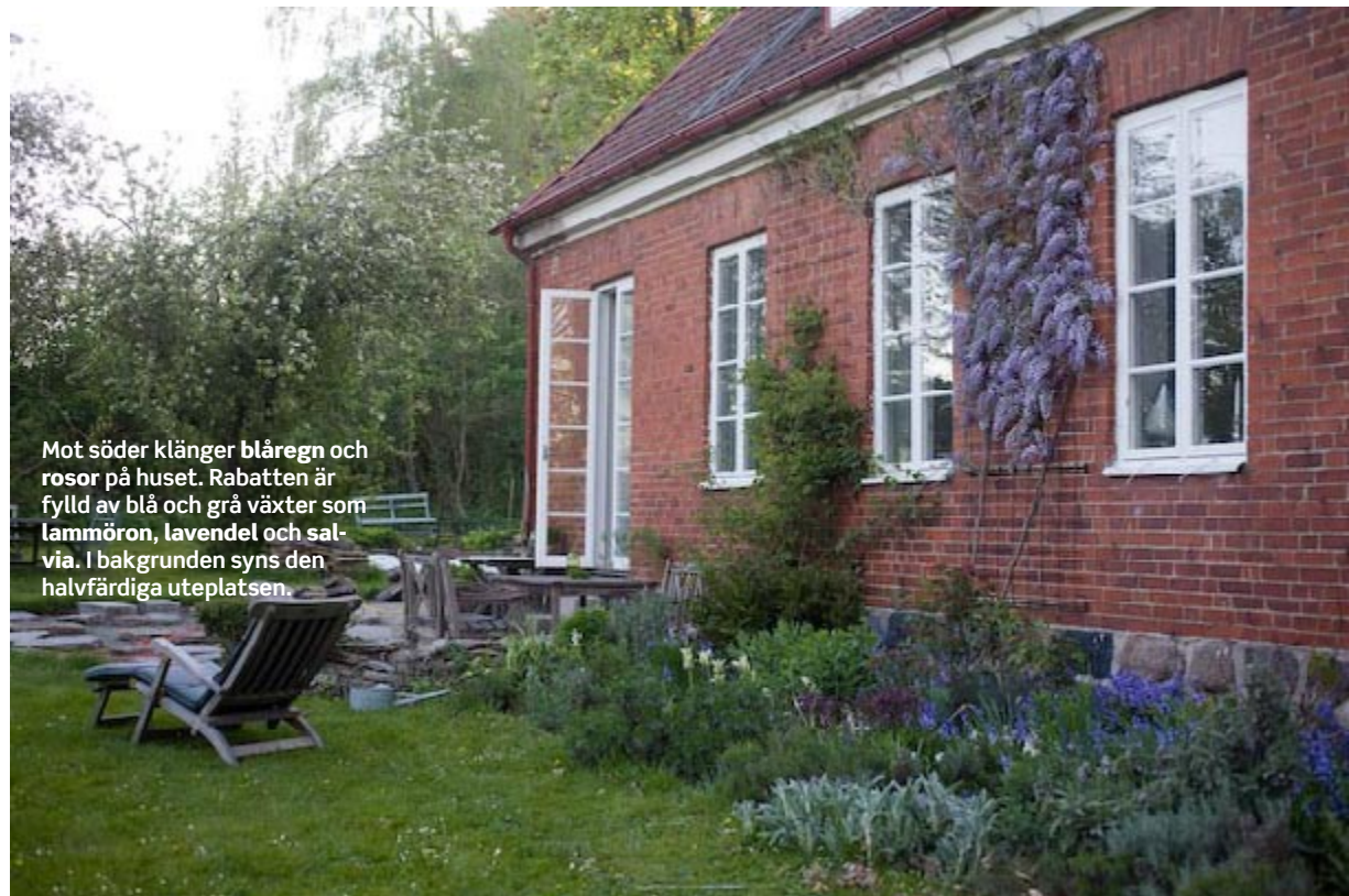
Mot söder klänger blåregn och rosor på huset. Rabatten är fylld av blå och grå växter som lammörön , lavendel och salvia . I bakgrunden syns den halvfärdiga uteplatsen.