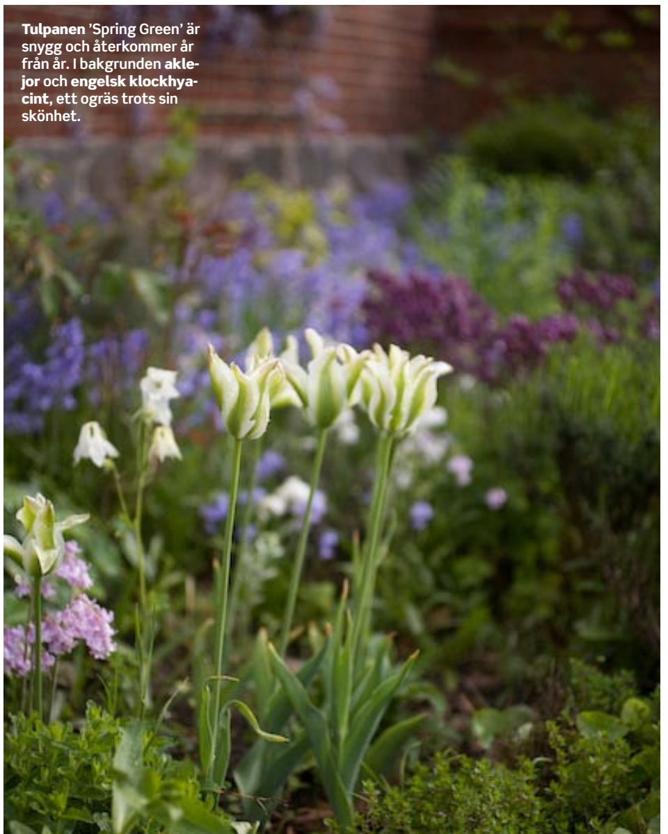
Tulpanen 'Spring Green' är snygg och återkommer år från år. I bakgrunden aklejor och engelsk klockhyacint, ett ogräs trots sin skönhet.