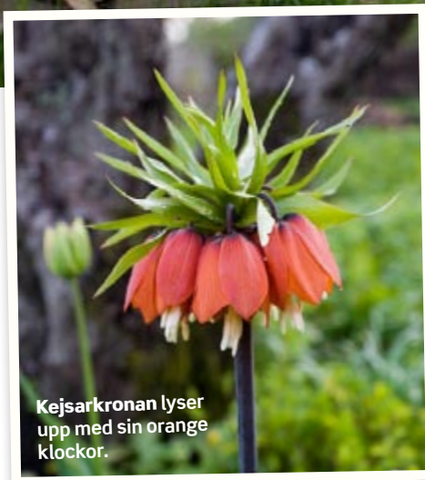
Kejsarkronan lyser upp med sin orange klockor.