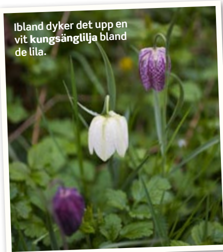
Ibland dyker det upp en vit kungsängslilja bland de lila.