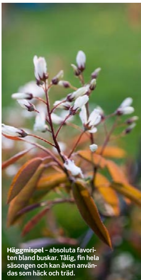
Häggmispel - absoluta favoriten bland buskar. Tålig, fin hela säsongen och kan även användas som häck och träd.