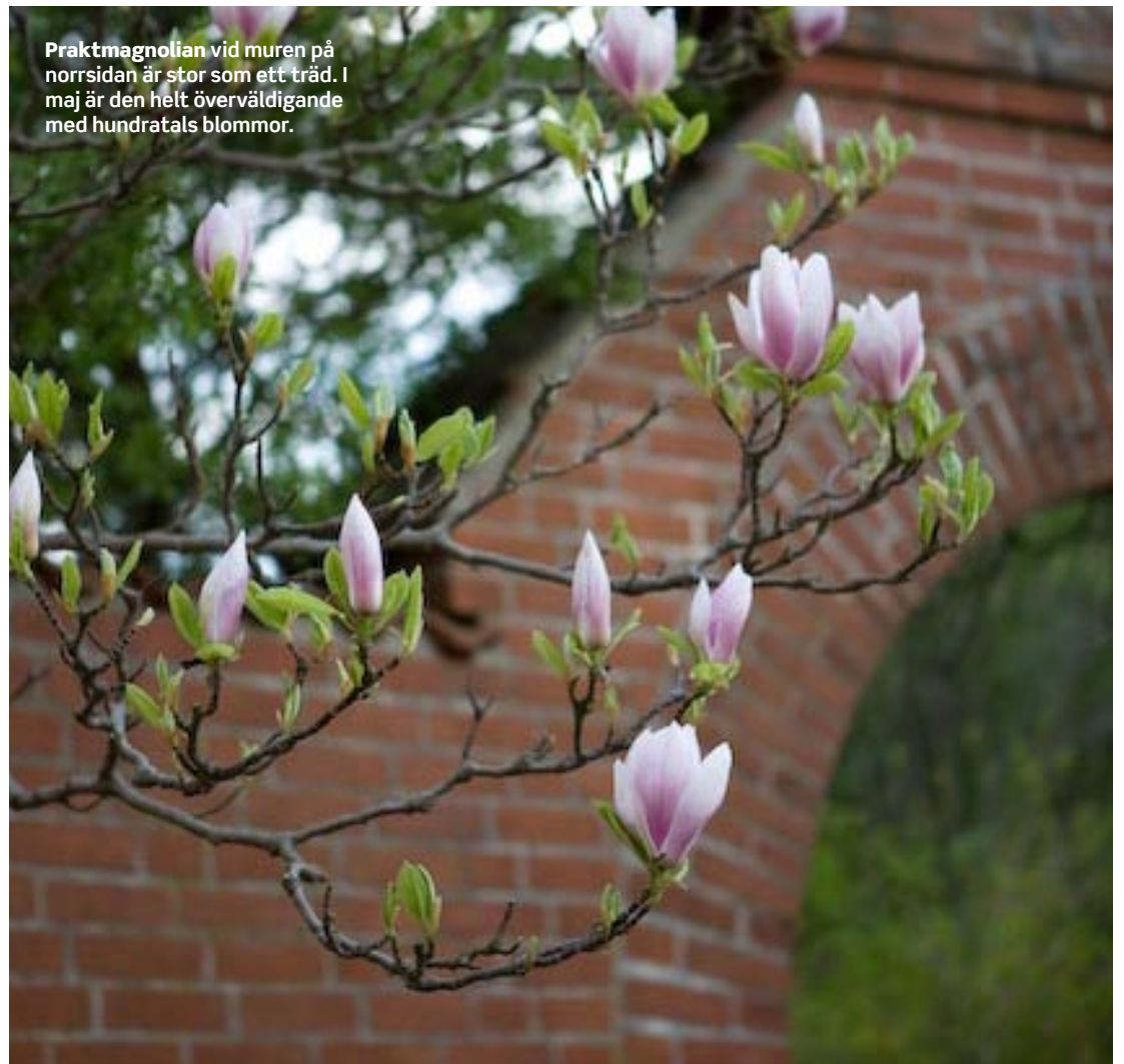
Praktmagnolian vid muren på norrsidan är stor som ett träd. I maj är den helt överväldigande med hundratals blommor.