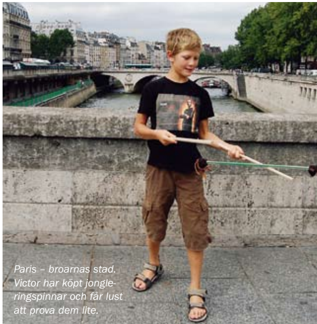
Paris – broarnas stad. Victor har köpt jongle- ringspinnar och får lust att prova dem lite.

våra biljetter – han som sitter i luckan knäpper mystiskt med nacken och lyckas trola bort våra biljetter tre gånger innan vi till slut får dem i vår hand.