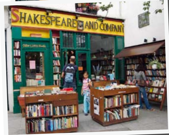
Shakespeare & Co är en legendarisk bokhandel i Quartier Latin. Här höll Hemingway och Sylvia Plath till en gång i tiden.