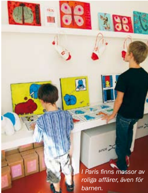
I Paris finns massor av roliga affärer, även för barnen.