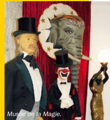
Musée de la Magie.

● Jardin d'Acclimatation – nöjespark för barn vid Bois de Boulogne. Karuseller, djur, teater, lotteristånd m.m.