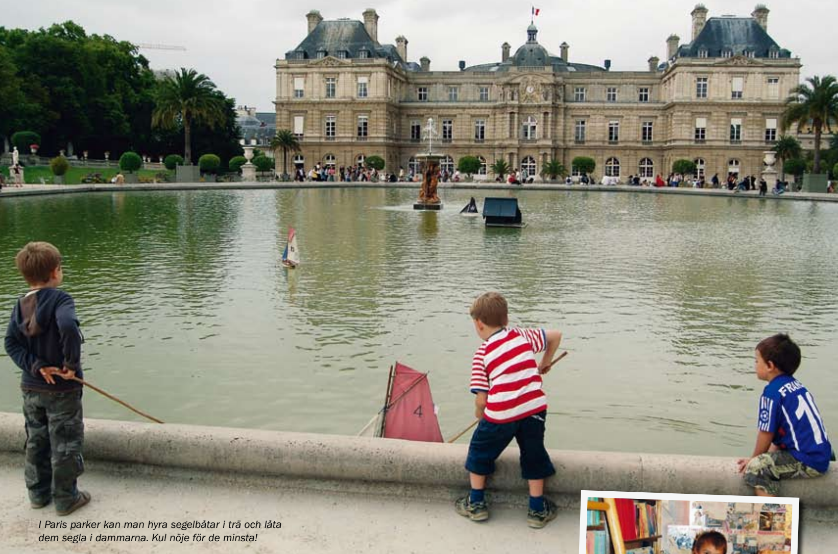
I Paris parker kan man hyra segelbåtar i trä och låta dem segla i dammarna. Kul nöje för de minsta!